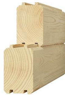
masívny hranol 92 x 140 – 170 mm

Masívne zrubové trámy sú vyrobené z jedného kusu dreva a predstavujú ekonomickú voľbu pre realizáciu zrubovej steny, ktorá ma vysokú užitnú hodnotu.