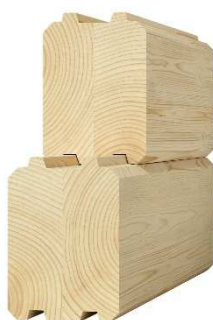
vrstvený hranol 140 x 140 – 170 mm