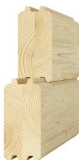
vrstvený hranol 92 x 140 – 170 mm

Masívne zrubové trámy sú vyrobené z jedného kusu dreva a predstavujú ekonomickú voľbu pre realizáciu zrubovej steny, ktorá ma vysokú užitnú hodnotu.