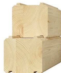
vrstvený hranol 240 x 140 – 170 mm

Vrstvené masívne zrubové trámy sú lepené z dvoch alebo troch samostatných vrstiev, čo predstavuje drahšiu, no tvarovo stálejšiu voľbu pre realizáciu zrubovej steny, ktorá ma vysokú užitnú hodnotu.