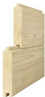
masívny hranol 28 x 140 – 170 mm