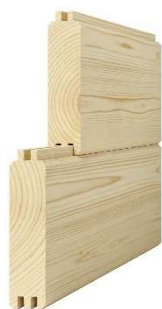
masívny hranol 44 x 140 – 170 mm