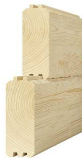
masívny hranol 68 x 140 – 170 mm