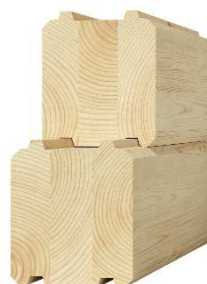
vrstvený hranol 202 x 140 – 170 mm