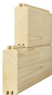
masívny hranol 64 x 140 – 170 mm